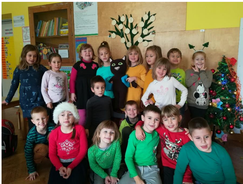
MI, 1. A, Z MAČKOM MURIJEM OB NOVEM LETU