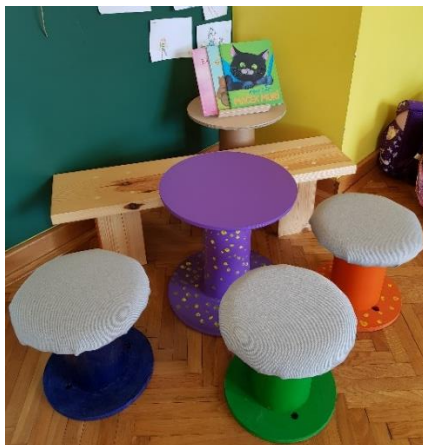
Slika 2: Murijev kotiček