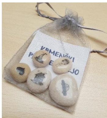
Slika 23: Kamenčki pripovedujejo.

Najbolj prizadevni bralci so za spodbudo pri branju prejeli zanimivo darilce. Igra Kamenčki pripovedujejo so pravi način za razvijanje domišljije in pripovedovanje najrazličnejših zgodbic.