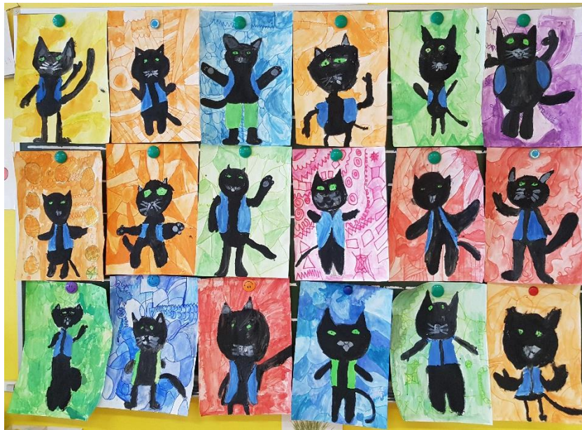
Slika 9: Nastale so prave umetnije.