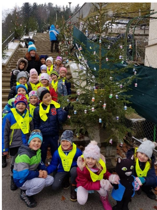
Slika 18: V središču Dobrne pred okrašeno smrečico.