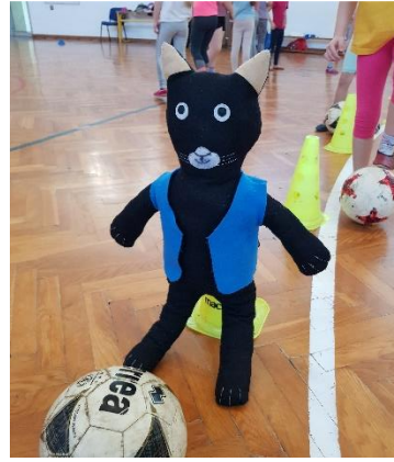
Sliki 12 in 13: Ema in Lili skrbita, da Murija ne zebe na zimskem sprehodu. Maček pri uri športa brca žogo.