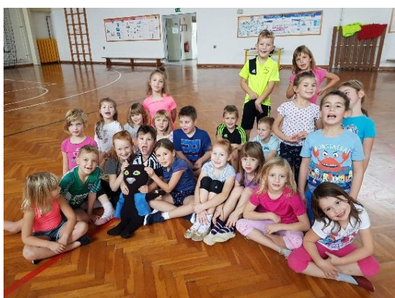
Slika 5: Pri razširjenemu programu (RaP).