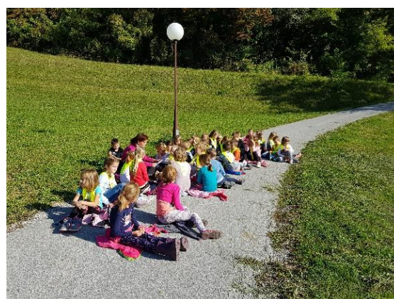
Slika 6: Pri branju na prostem.