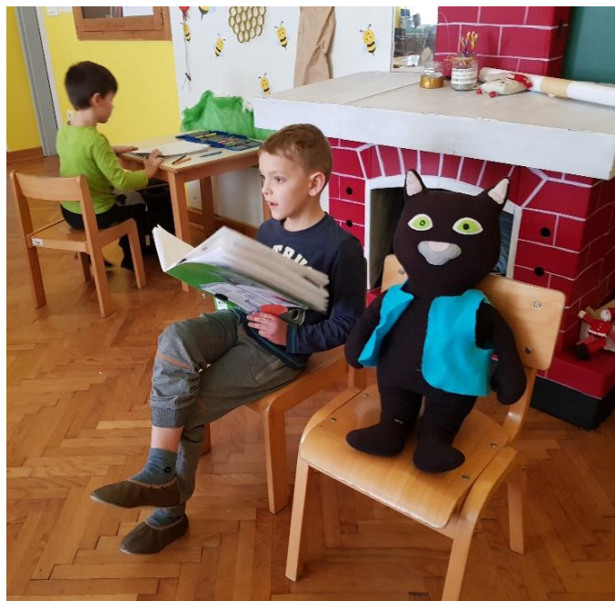
Slika 2: Timova predstavitev doživetij