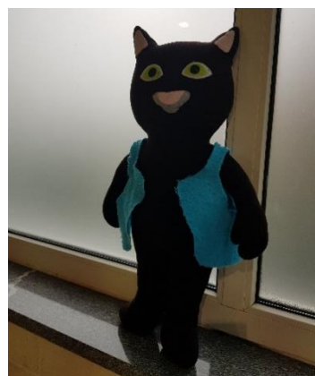
Sliki 3 in 4: Z Murijem na bazenu