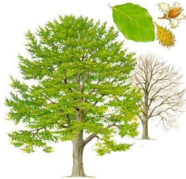
Slika 1: Bukev