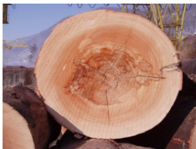
Slika 2: Prečni prerez bukovega debla